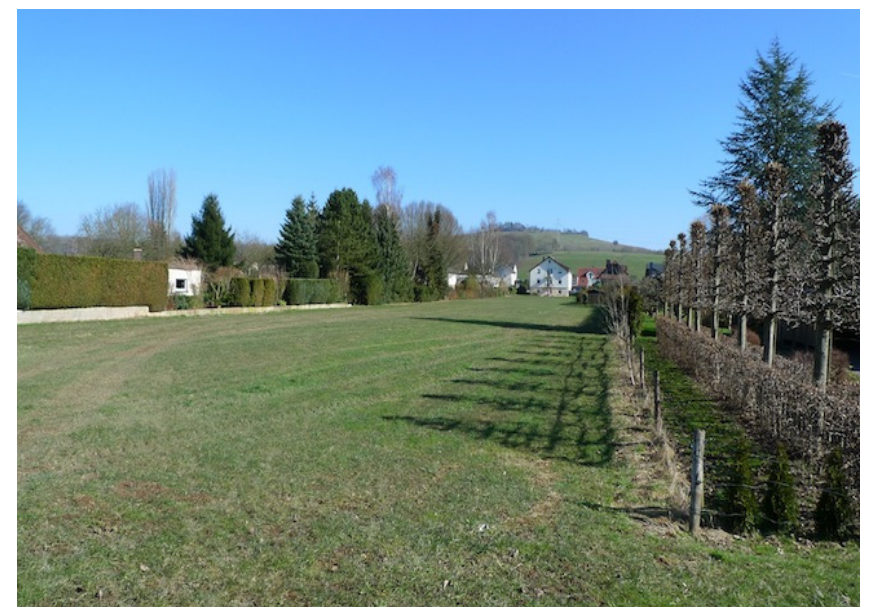
(3) Blick von der Porte des Ardennes auf Weideland