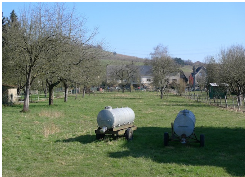
(2) Blick auf eine Obstbaumwiese