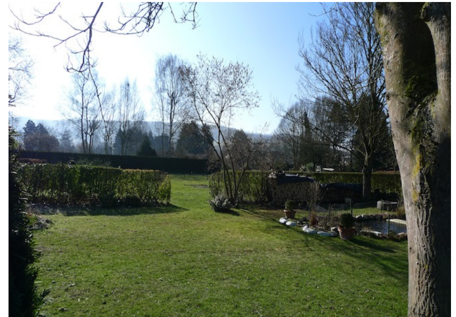
(1) Blick auf die Gärten im Norden der Fläche