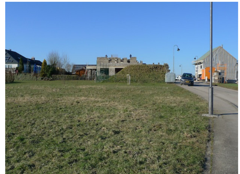
(3) Blick nach Norden (Wasserspeicher)