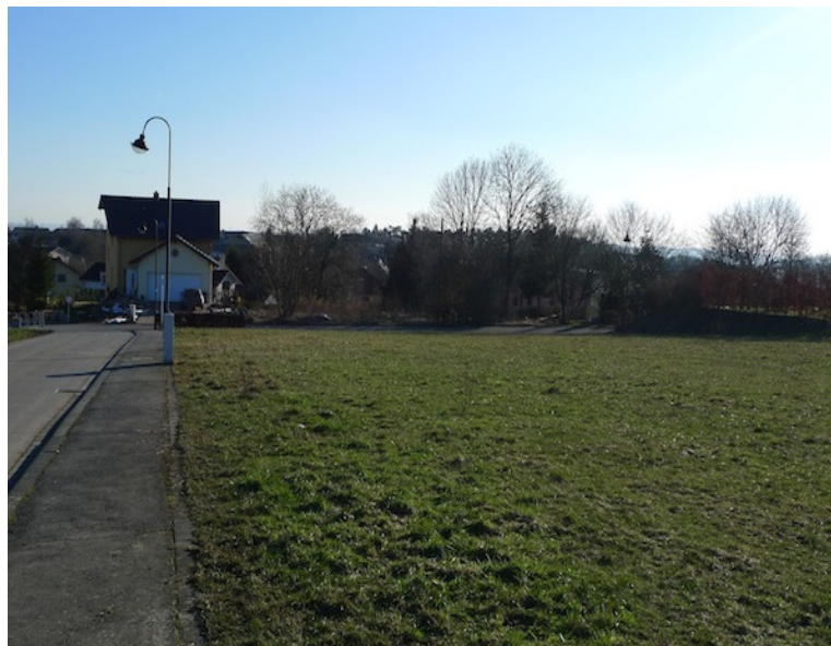
(2) Blick nach Süden Das Gelände fällt nach Süden ab