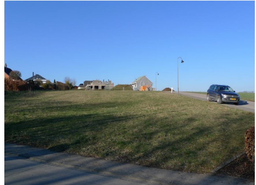
(1) Blick nach Norden Das Gelände fällt nach Süden ab und ist weithin sichtbar