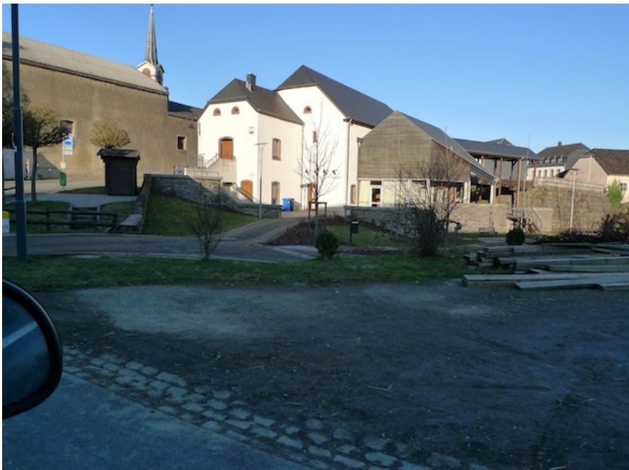
(2) Blick zum Kulturzentrum