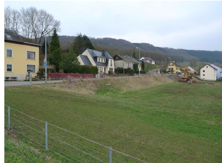
(1) Blick nach Südwesten