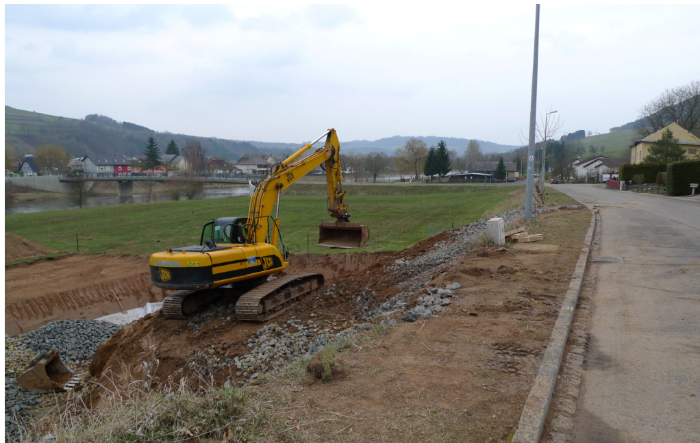
(2) Blick nach Nordosten Ein Bauplatz ist in Arbeit