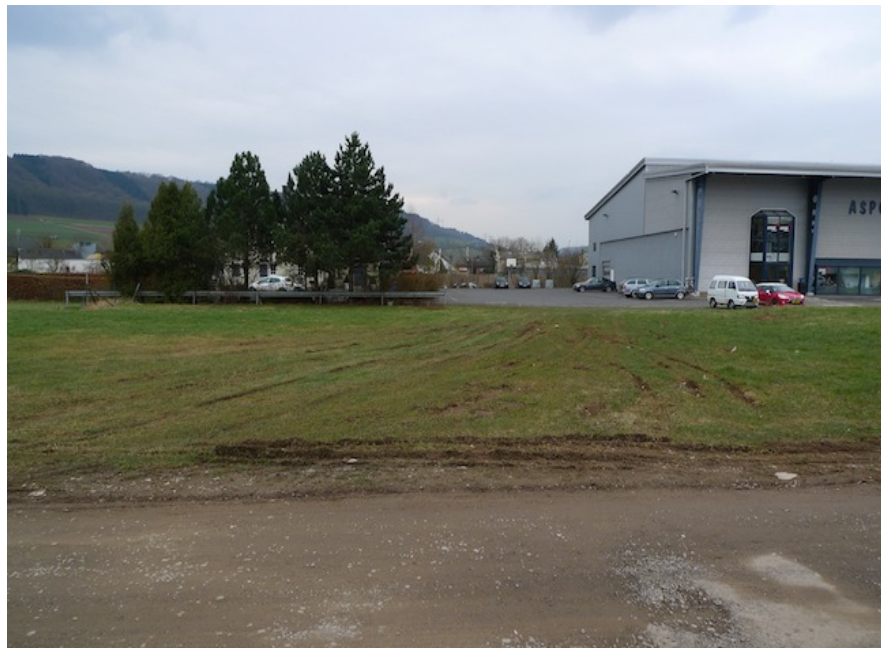
(2) Blick nach Südwesten