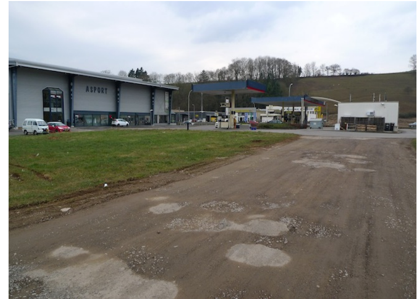
(1) Blick nach Nordwesten Grünland zwischen Gewerbebetrieben