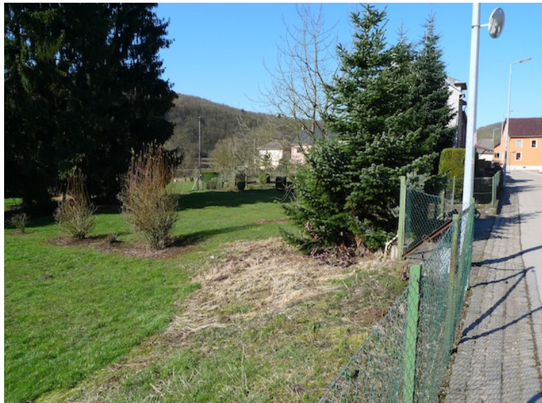
(2) Blick nach Norden im Hintergrund Teile des alten Dorfes