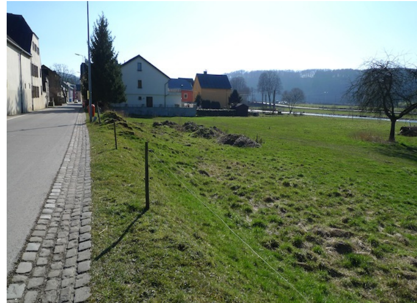
(3) Blick nach Süden Grünland an der Sauer