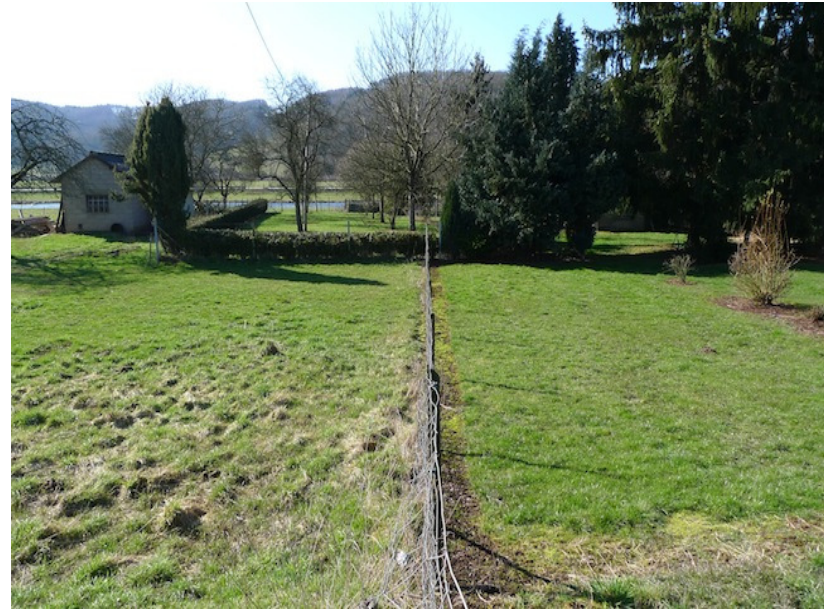
(1) Blick nach Westen