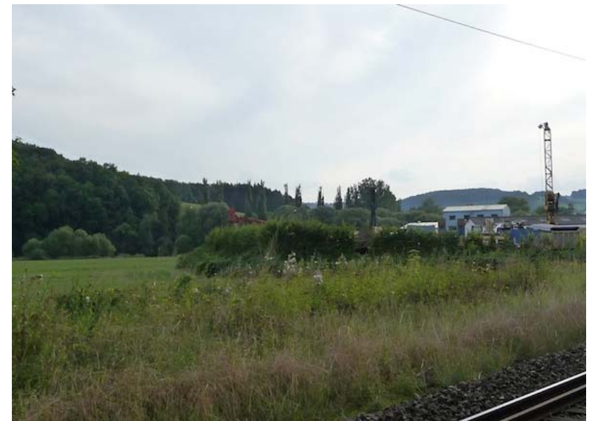
(3) Blick nach Südwesten eingegrüntes Gelände