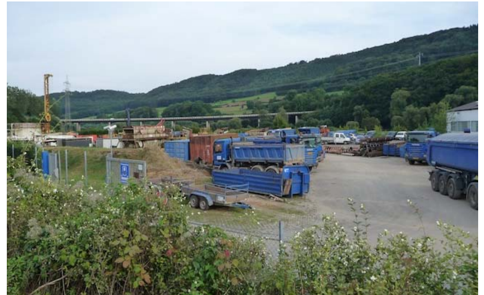
(1) Blick nach Süden unbebaute Betriebsfläche