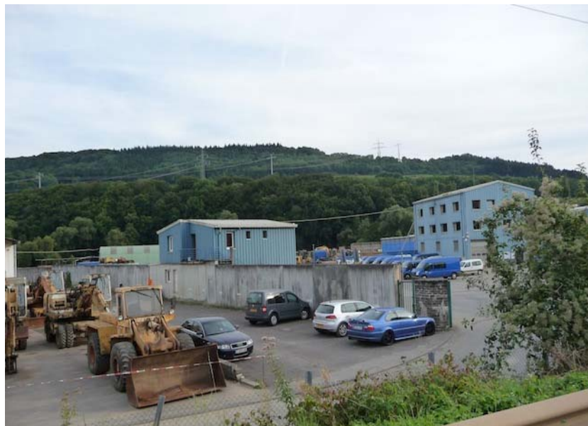
(2) Blick nach Südwesten Bebauung des Betriebes