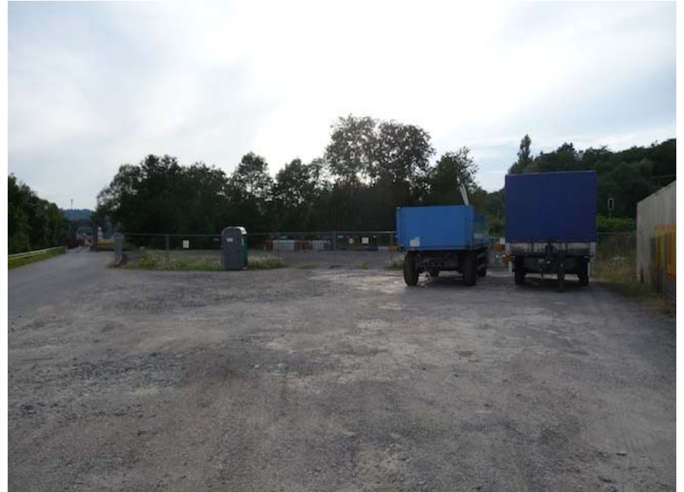
(1) Blick nach Westen unbebaut aber versiegelt