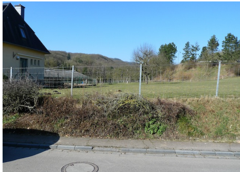
(2) Blick nach Norden