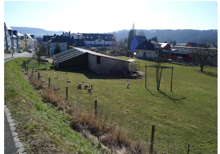
(1) Blick nach Süden landwirtschaftlich genutzte Fläche innerhalb des secteur protégé