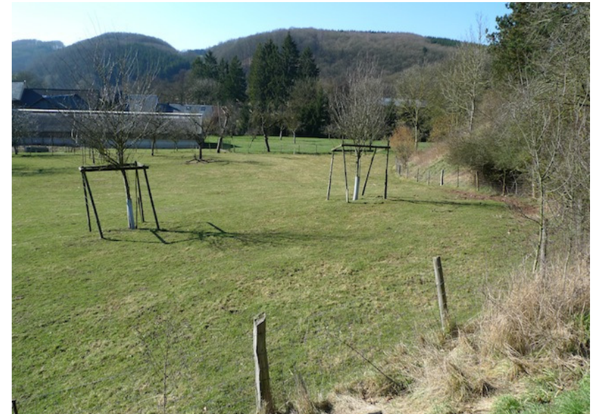
(3) Blick vom CR nach Westen jüngst gepflanzte Obstbäume