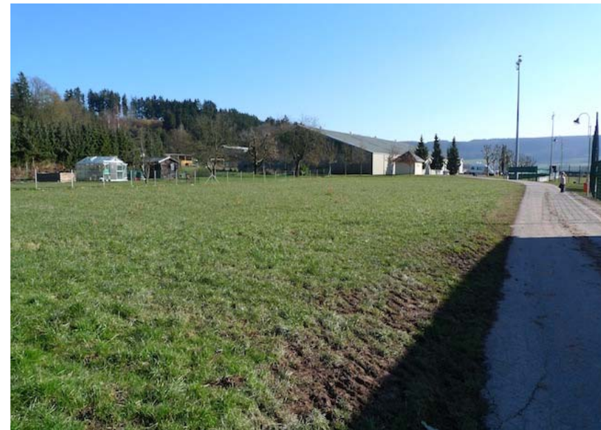
(1) Blick nach Südosten