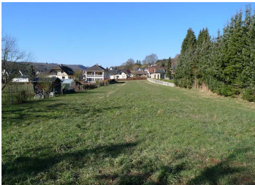
(2) Blick zur Rue du Cimetière