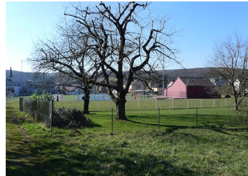
(3) Obstbäume auf der Fläche