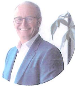
Claude Turmes, Minister für Landesplanung Ministre de l'Aménagement du territoire

DE • „Hochwertige Wohn-, Wirtschafts- und Freizeitmöglichkeiten in einer naturnahen Umgebung – nahe beieinander und über eine moderne Infrastruktur verbunden. Darauf zielt die Ausarbeitung des Leitbildes „Vision Nordstad 2035“ ab. Ein kohärentes Entwicklungskonzept, bei dem die MitbürgerInnen der Nordstad und die Verbesserung ihrer Lebensqualität im Mittelpunkt der Planung stehen und dies unter Wahrung der lokalen Identität. Die geografische Lage der Nordstad verleiht ihr zudem eine strategische Bedeutung für die wirtschaftliche und soziale Entwicklung im Norden Luxemburgs. In den letzten Jahren hat die Regierung daher die Investitionen in der Region intensiviert und erhöht. Dies, damit neben der Stadt Luxemburg und der Südregion ein dritter Entwicklungspol entsteht. Ein Ziel des Leitbildes ist es den gesamten Naturraum der Nordstad zu einem großflächigen Landschaftspark zu verknüpfen.