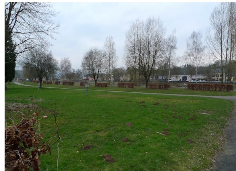
(3) Das Gelände des Campingplatzes liegt direkt an der Sauer