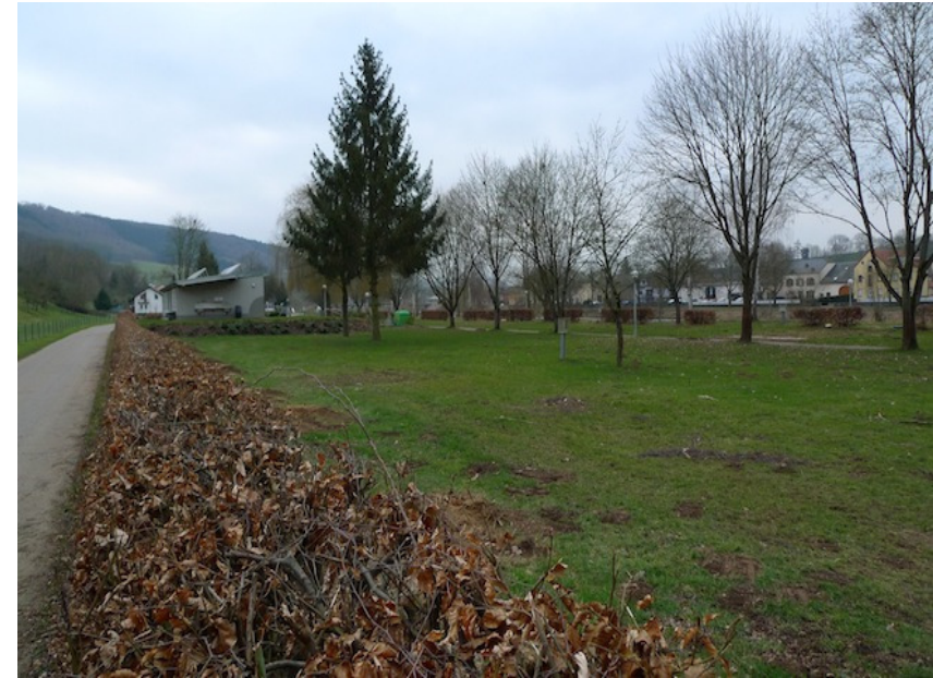
(1) Blick auf das Empfangshaus