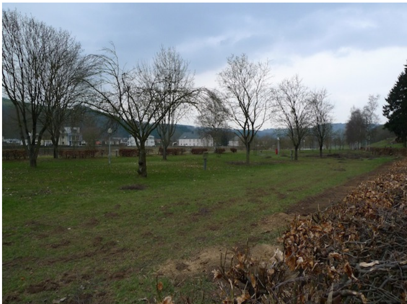
(2) mit Bäumen bestandene Wiese