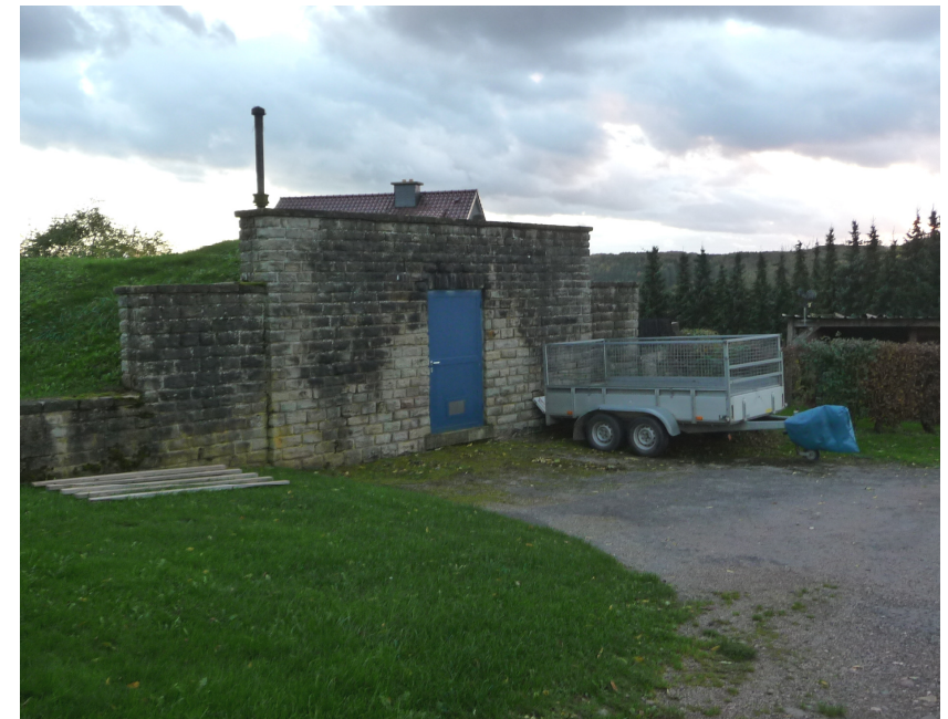
(3) Blick auf den Trinkwasserbehälter