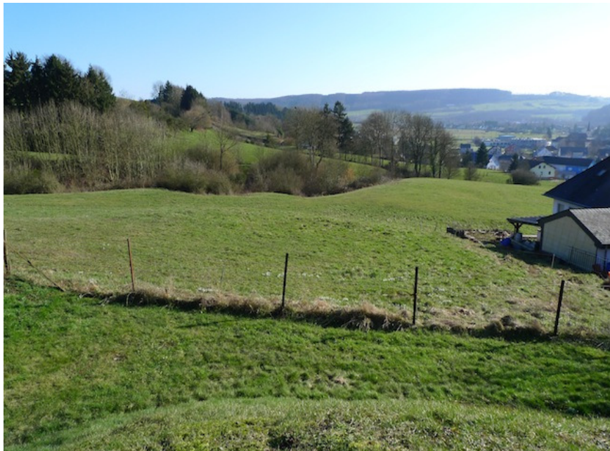
(2) Blick nach Süden