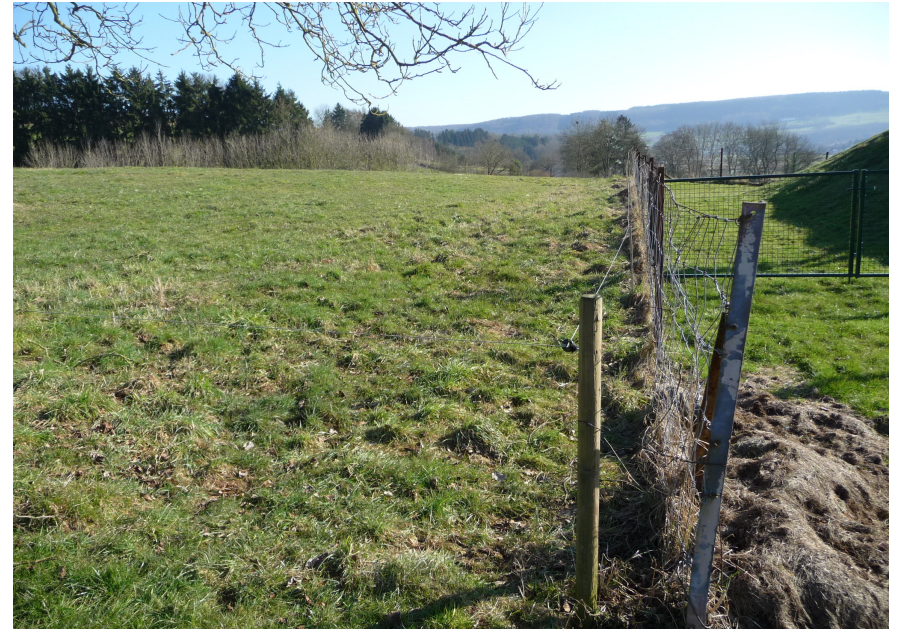
(1) Blick nach Südosten