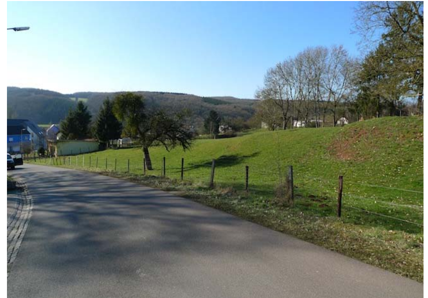
(1) Blick nach Westen Fläche am nördlichen Siedlungsrand von Erpeldange