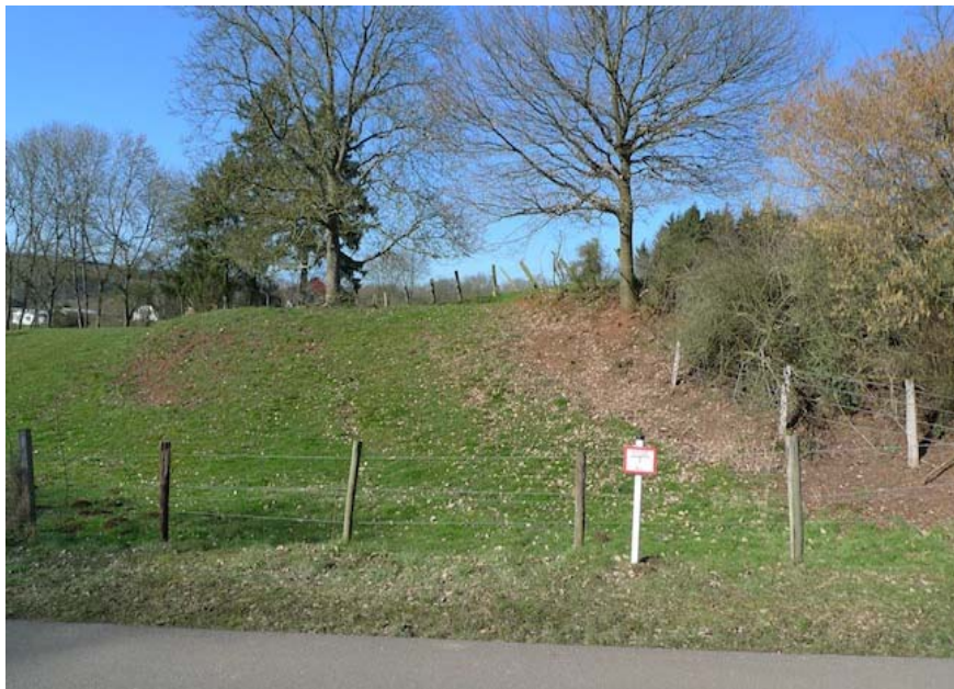
(2) Blick nach Norden Eine Eingrünung ist bereits vorhanden