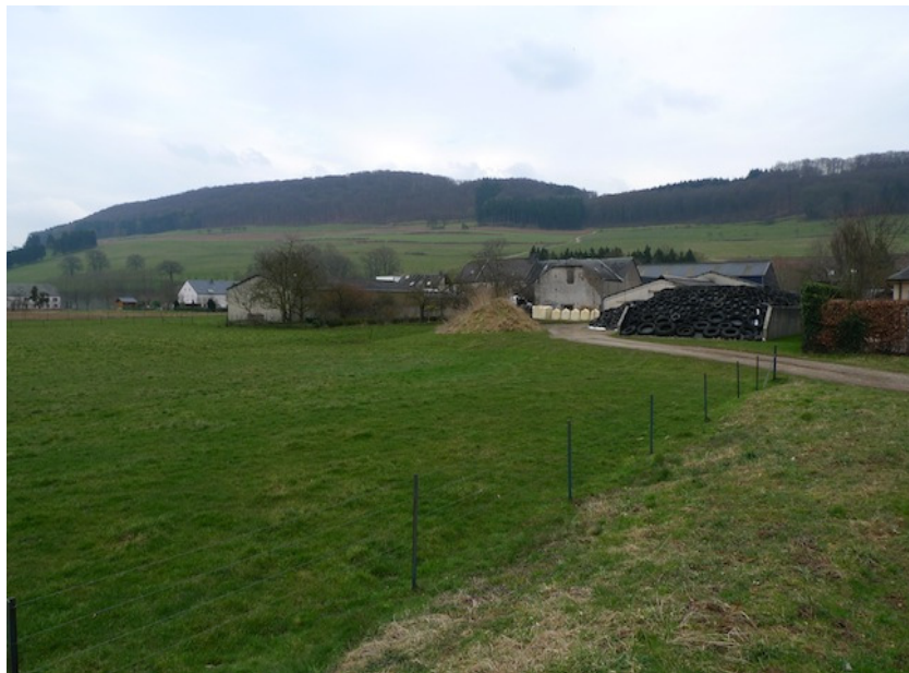
(2) ein alter, schützenswerter landwirtschaftlicher Hof liegt direkt an der Fläche