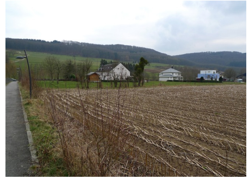
(3) Blick zur Sauer Einfamilienhäuser entlang der Uferstraße