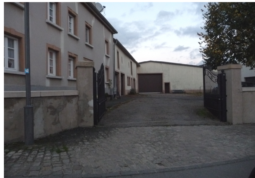
(3) Blick auf den 2. Zufahrtsweg