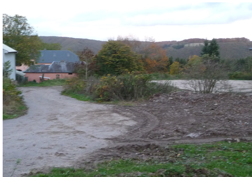
(2) Blick nach Nordosten