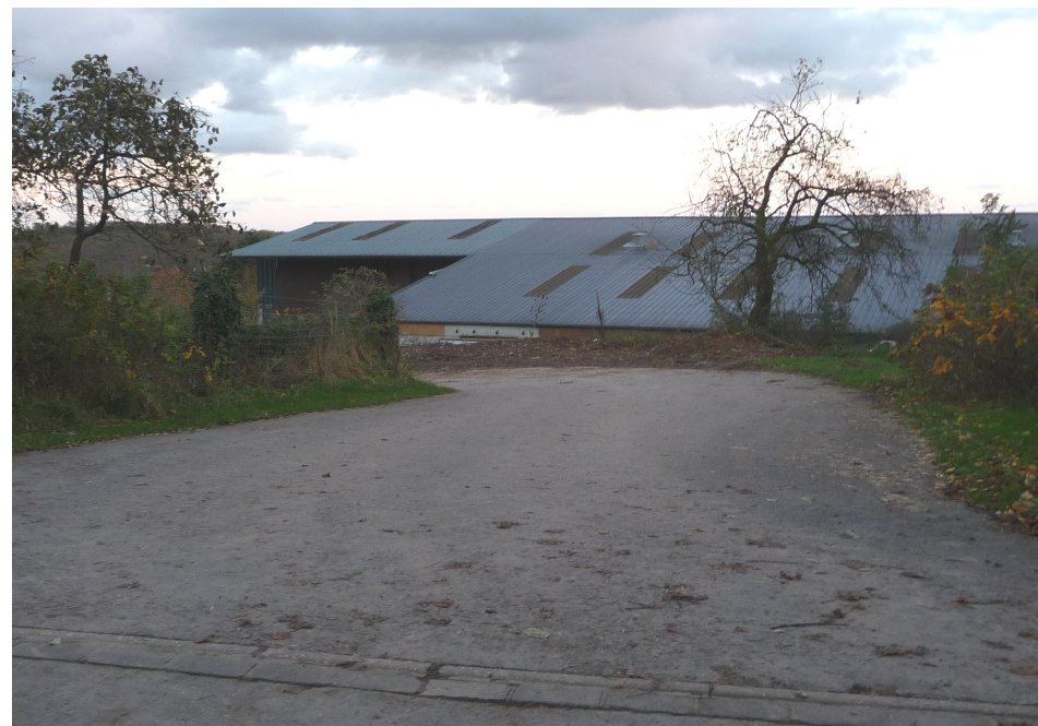
(1) Blick auf die Zufahrt