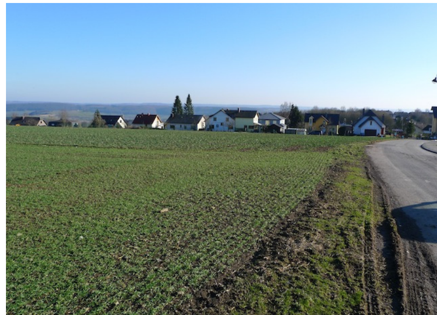
(1) Blick nach Süden Die Fläche grenzt an den alten Ortsrand an