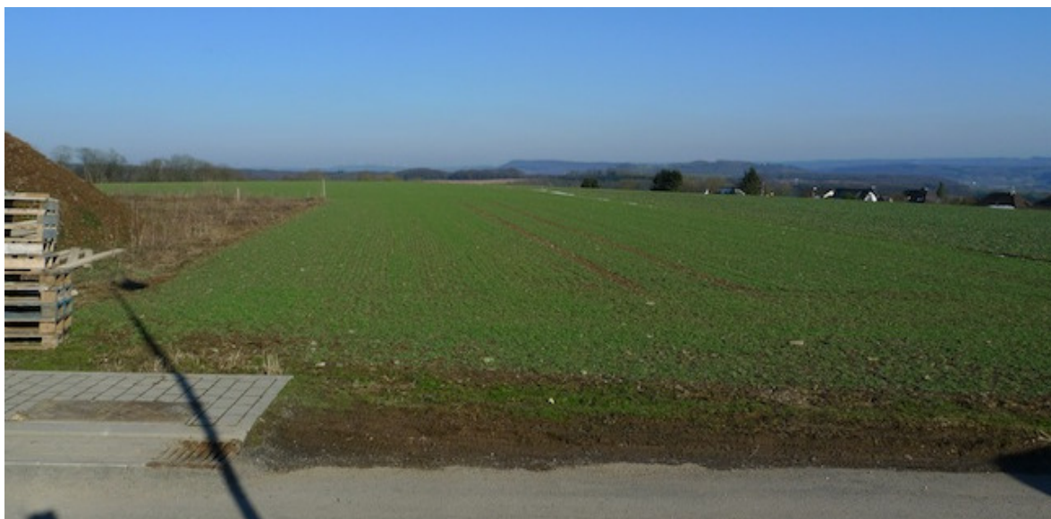
(2) Blick nach Osten Ackerland am Ortsrand