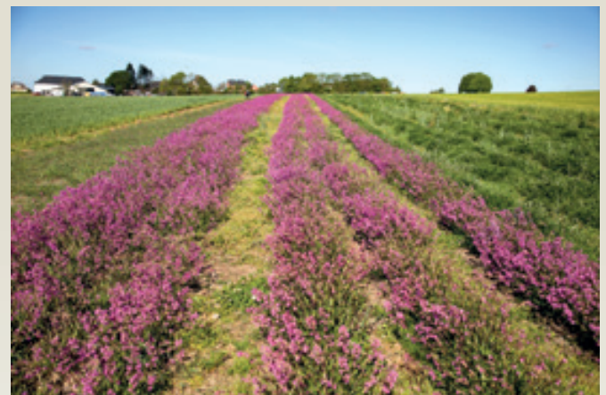
Eng Blummewiss, déi mat der Mëschung LUX-Blumenwiese ugeséint ginn ass.