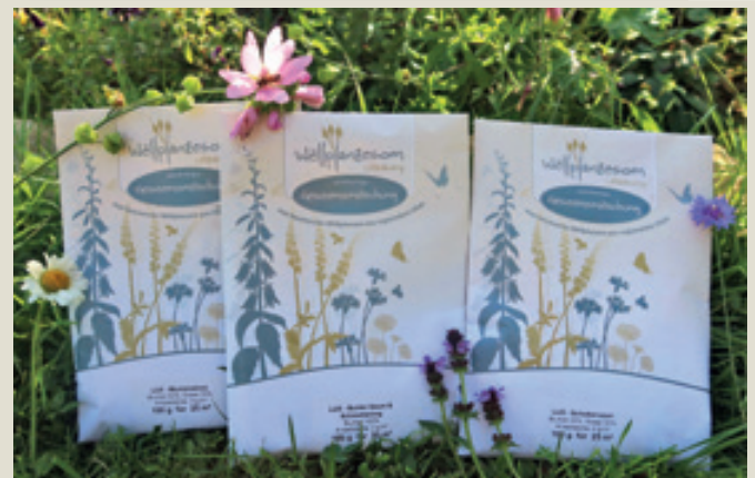
D'Geseemsmëschung: LUX-Blumenwiese, LUX-Schotterrasen a LUX-Bunter Saum & Schmetterlingspflanzen.

Fir déi richteg LUX-Mëschung auszewielen, berode mir lech gären.