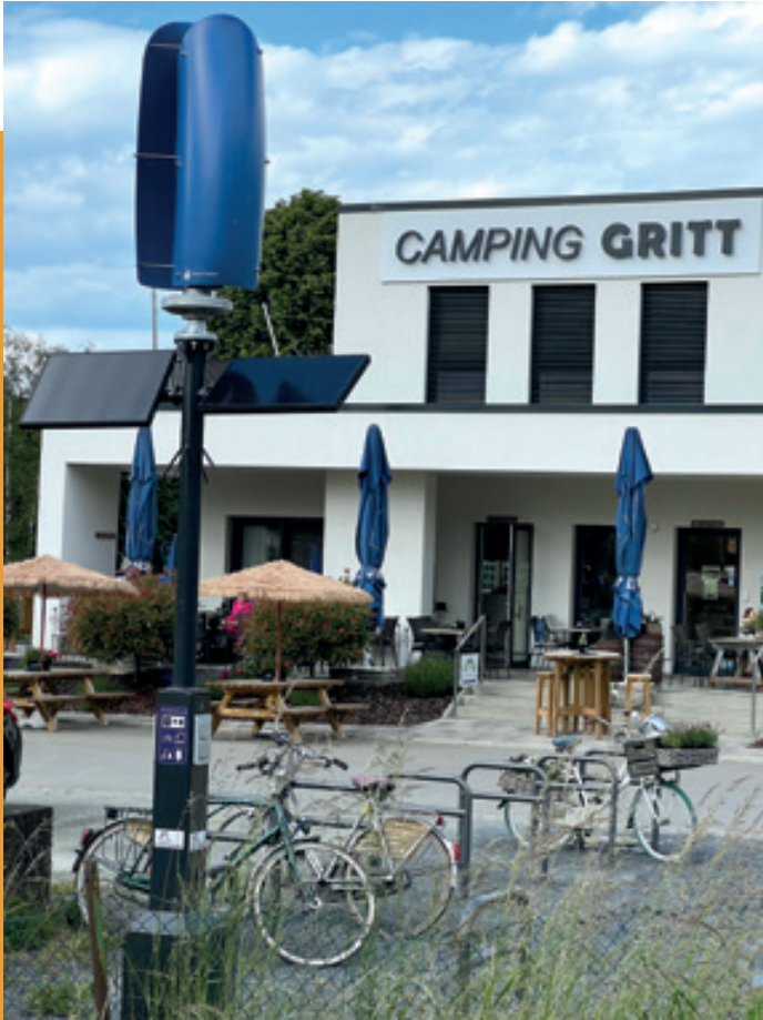
Installatioun vun enger wand- a solarbedriwwener Stroumtankstell um Camping „Um Gritt“